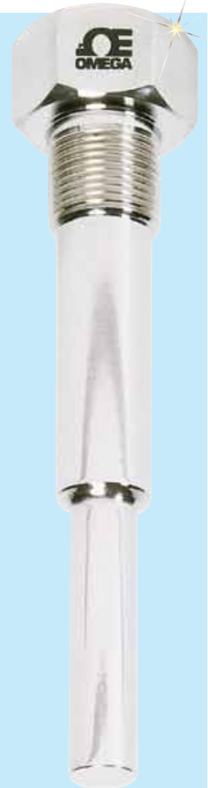
图片接近实际尺寸。

如欲订购, 请访问 cn.omega.com/series_260s , 了解价格和详情