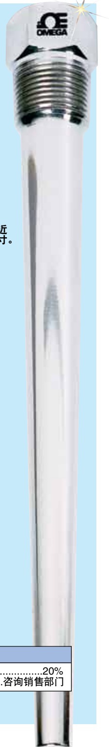
图片接近实际尺寸。

如欲订购, 请访问 cn.omega.com/series_260h , 了解价格和详情