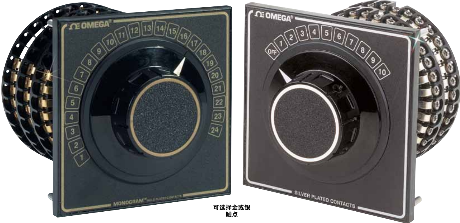
可选择金或银触点