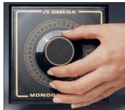
带镀金触点的MONOGRAM®系列

双极SW和OSW系列开关具有一个方便的“关闭”位置。“关闭”位置可留作开路或短路，以防止假信号在热电偶仪器上进行记录。每个极点均完全隔离。为实现快速简单的接线，开关后面的接线端均有清晰标示。