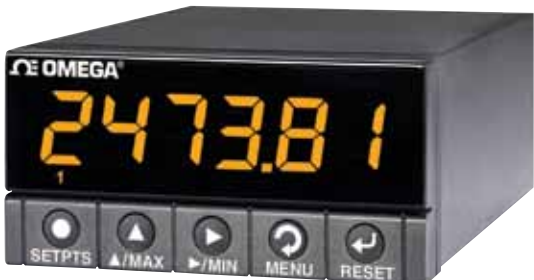
DP41-B, 图片小于实际尺寸, 参见 cn.omega.com/dp41b