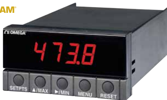
DP25B-E, 图片小于实际尺寸, 参见 cn.omega.com/dp25b