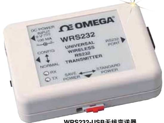
WRS232-USB无线变送器， 图片接近实际尺寸。