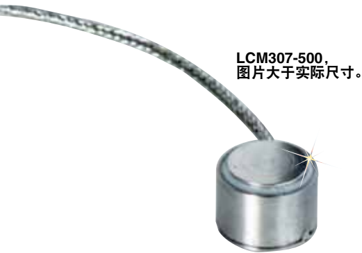
LCM307-500， 图片大于实际尺寸。