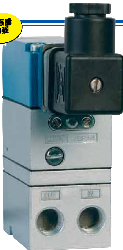
带DIN电气终端的IP710- X100-D，图示为实际尺寸。