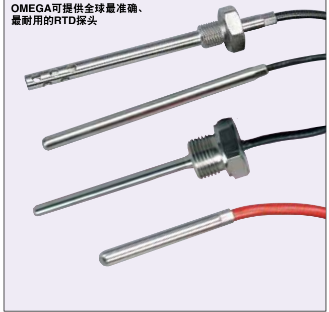
OMEGA可提供全球最准确、最耐用的RTD探头

OMEGA提供各种RTD配置，而且让OMEGA倍感骄傲的是公司能生产全球经过最彻底的测试、最准确并且最耐用的探头。