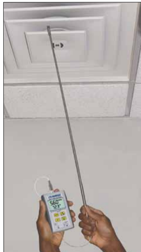
正在测量空调管口的气流。