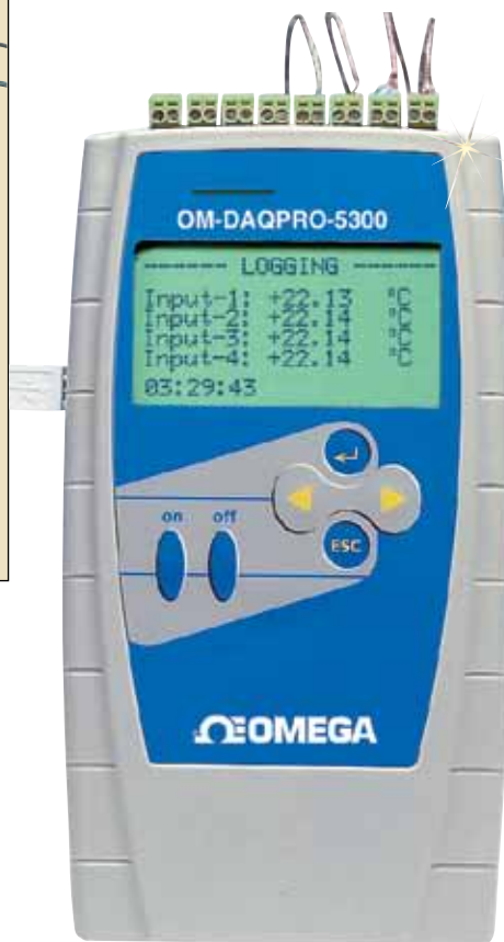
OM-DAQPRO-5300, 含传感器, 图片小于实际尺寸