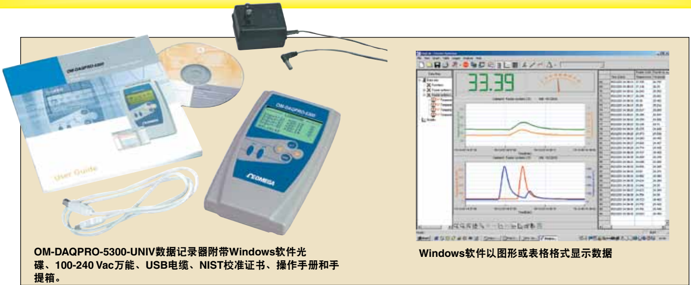
OM-DAQPRO-5300-UNIV数据记录器附带Windows软件光碟、100-240 Vac万能、USB电缆、NIST校准证书、操作手册和手提箱。